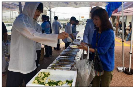
新生おおふなとさんま祭