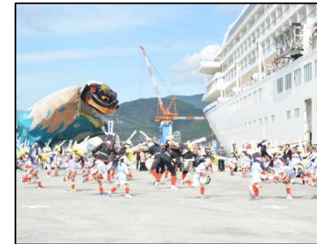
クルーズ客船歓迎行事