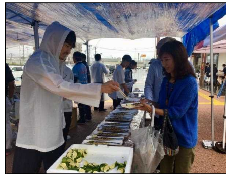
新生おおふなとさんま祭