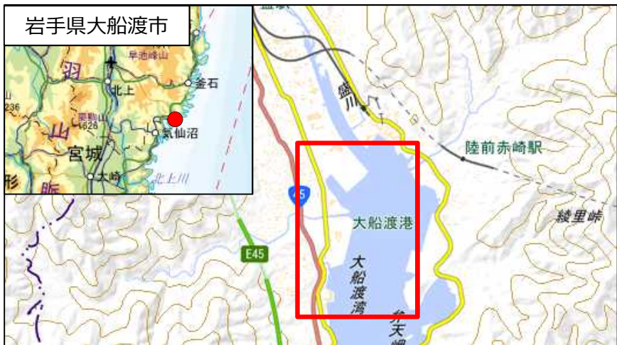
国土地理院地図（電子国土Web）( http://maps.gsi.go.jp )をもとに国土交通省作成