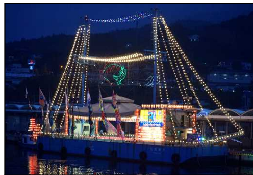
三陸・大船渡夏祭り