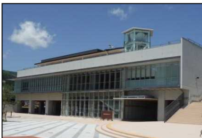
【代表施設】おおふなぽーと