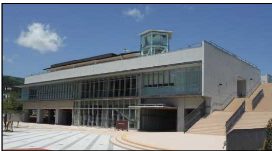
おおふなぽーと (大船渡市防災観光交流センター)