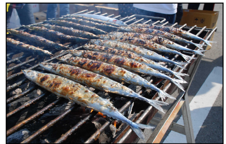
おおふなと名物さんま

※ 「みなとオアシス」の関連情報については、下記 URL からご覧いただけます。