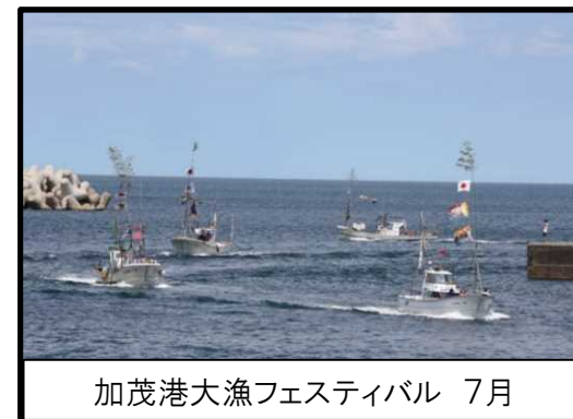
加茂港大漁フェスティバル 7月