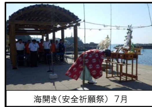
海開き(安全祈願祭) 7月