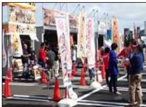
「みなとオアシス」における地域振興イベント