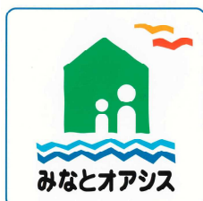
みなとオアシス標章（シンボルマーク）

※ みなとオアシス： 旅客船ターミナル、文化交流施設、みなとの資料館、情報提供施設、地元産品の物販施設や飲食施設などで構成されています。「みなとオアシス加茂」の詳細は、別紙－1、別紙－2をご参照願います。