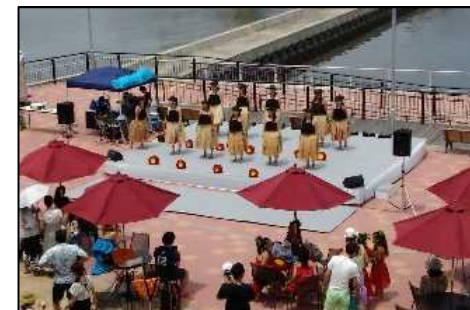
千葉みなとマリンフェスタ