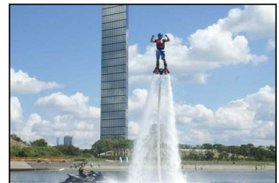
フライボード体験