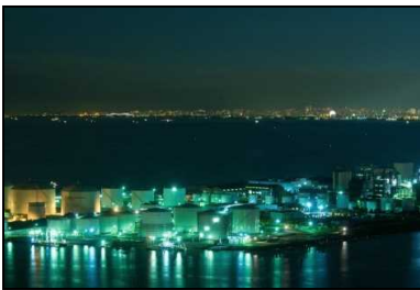
「千葉ポートタワー」から見た工場夜景

なお、3月24日（土）、代表施設「ケーズハーバー」において、「みなとオアシス千葉みなと」の登録証交付式を行います。