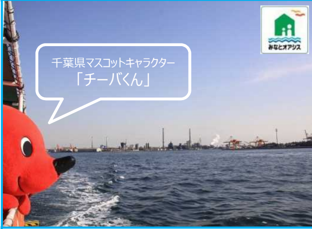
千葉県マスコットキャラクター「チーバくん」

乗って楽しく、見て学べる観光船。迫力のあるコンテナターミナルや工場の風景を楽しみながら、千葉港を間近に実感できます。