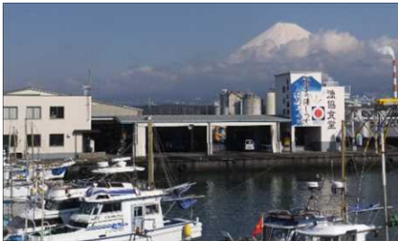
【代表施設】田子の浦港漁協食堂