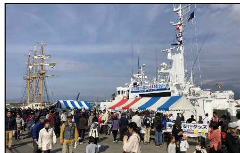
田子の浦ポートフェスタ