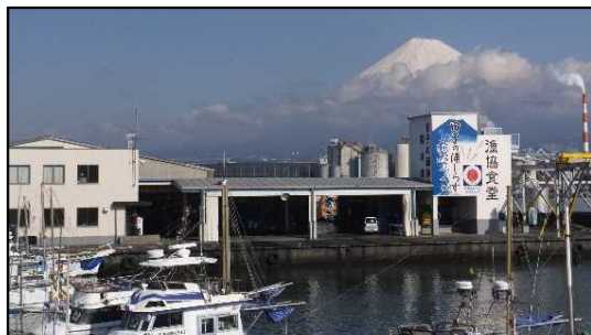
田子の浦港漁協食堂