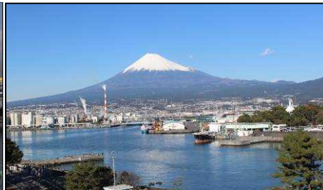
田子の浦港と富士山