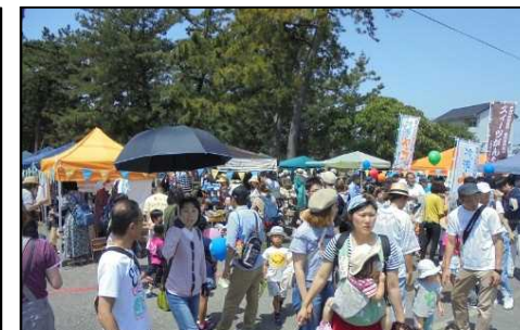
田子の浦みなとマルシェ