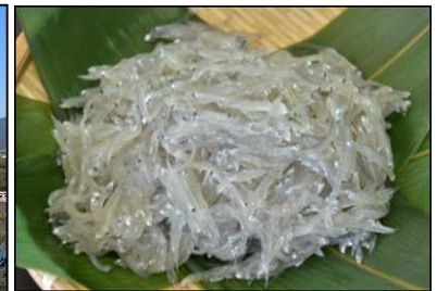
銘品「田子の浦しらす」