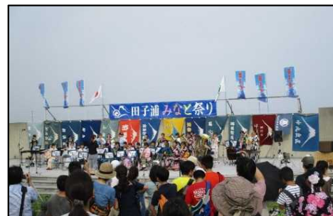
田子浦みなと祭り