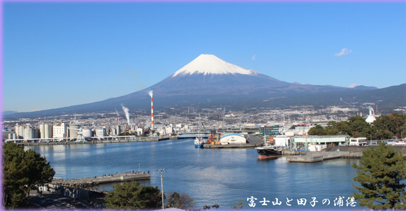
富士山と田子の浦港