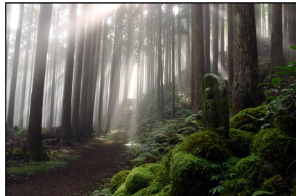
世界遺産「熊野古道」