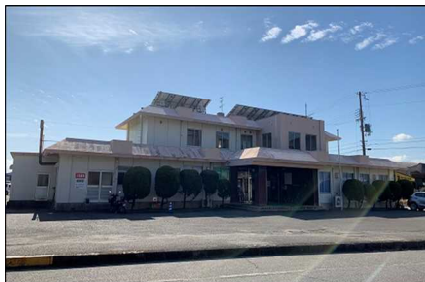
【代表施設】新宮港湾会館