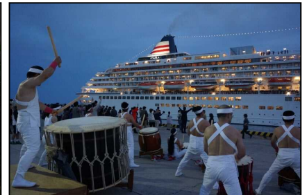
クルーズ船おもてなし