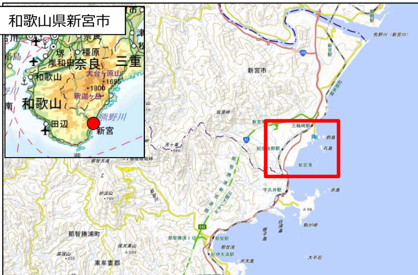
国土地理院地図（電子国土Web）( http://maps.gsi.go.jp )をもとに国土交通省作成