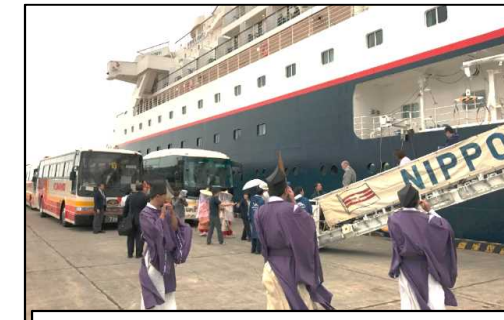
クルーズ客船（歓迎・お見送り）