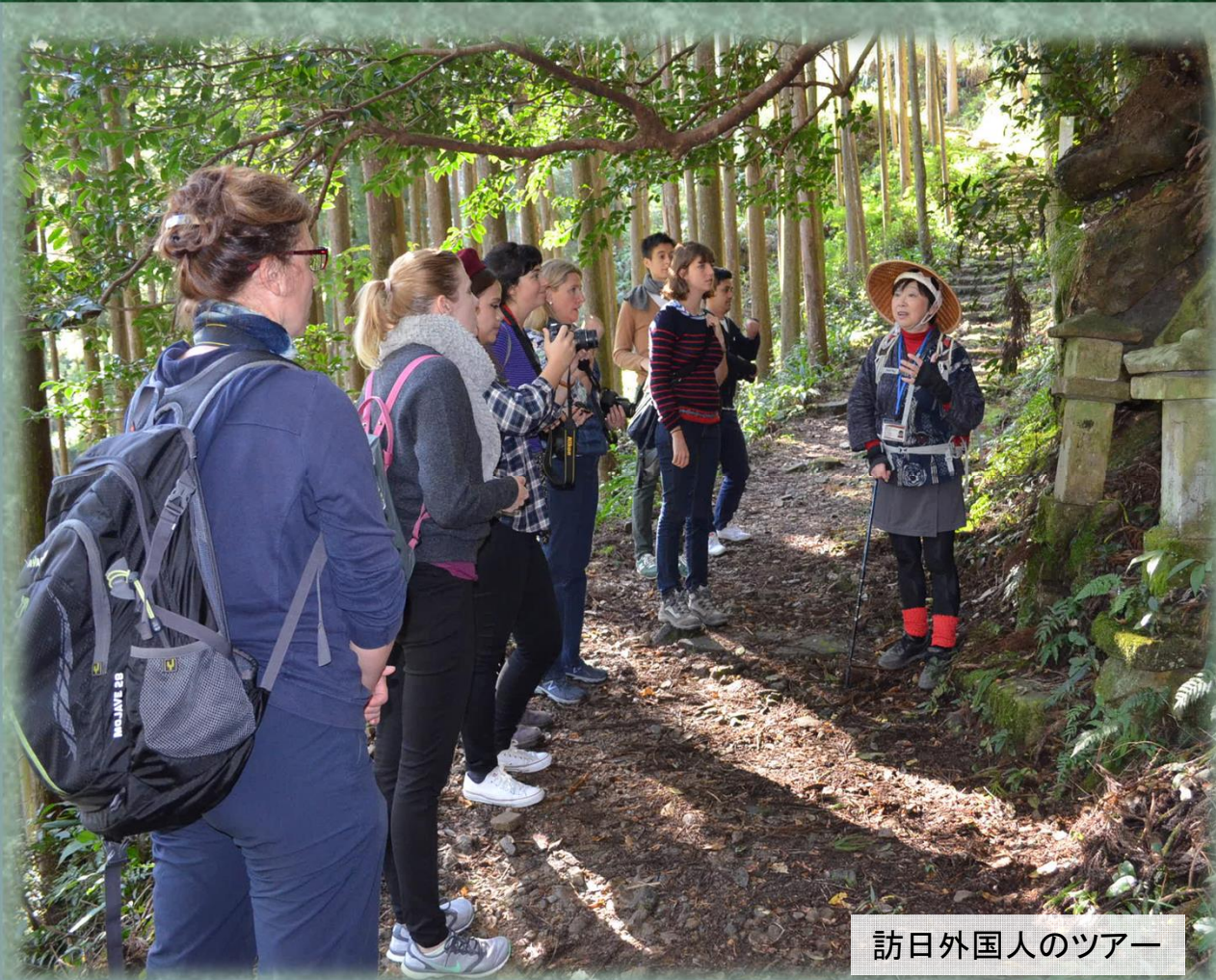
訪日外国人のツアー