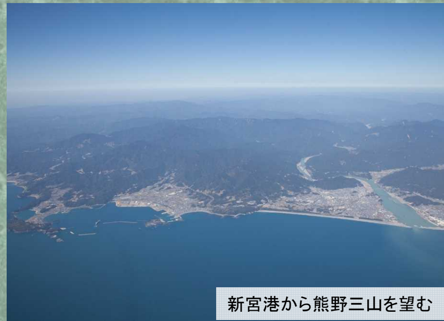
新宮港から熊野三山を望む