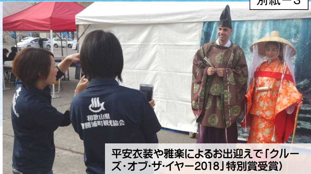
平安衣装や雅楽によるお出迎いで「クルーズ・オブ・ザ・イヤー2018」特別賞受賞

見送り隊には地元はもちろん、市外・県外からも入会可能で、見送りに手を振るだけでもOKです。