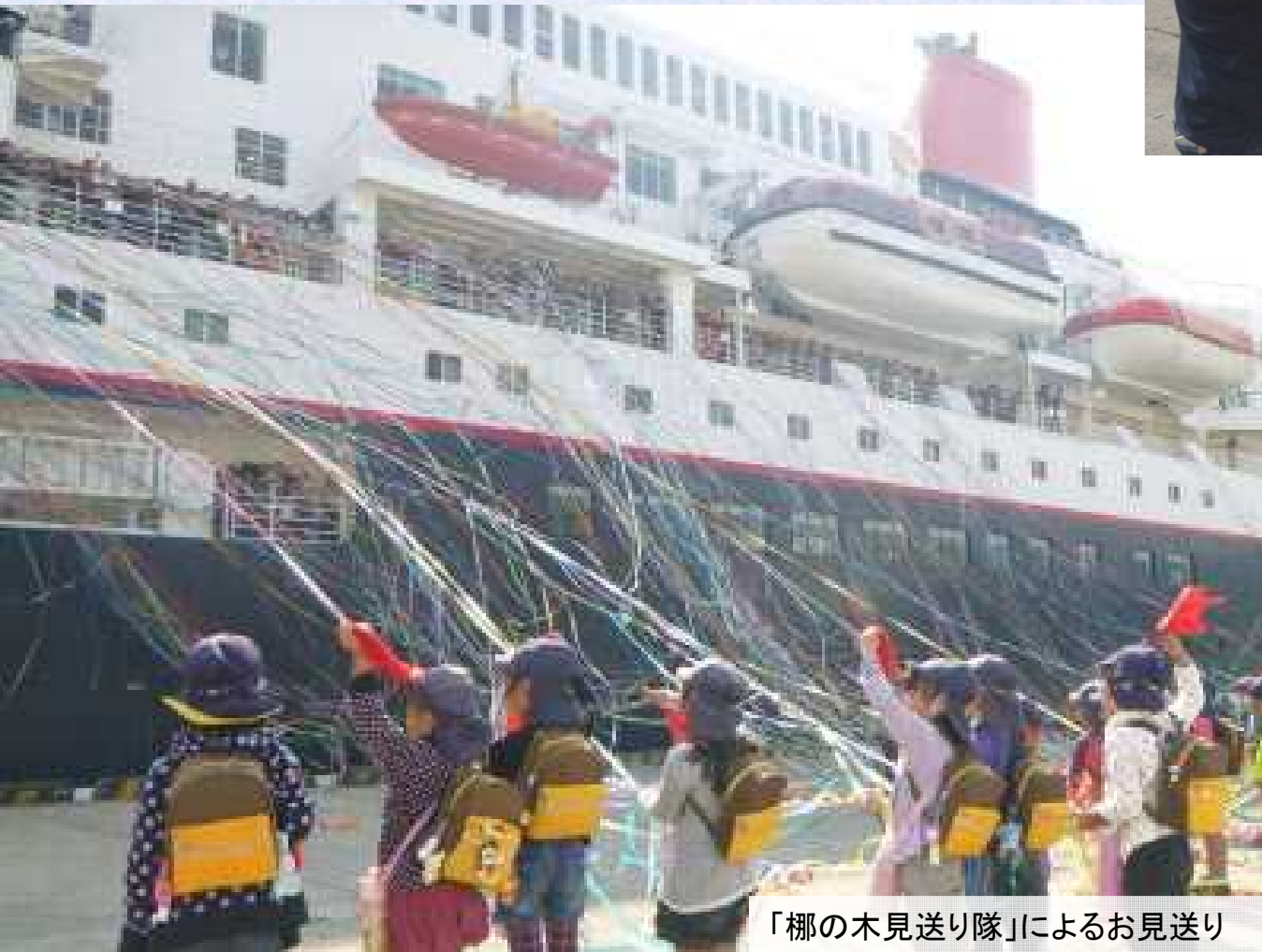
「椰の木見送り隊」によるお見送り