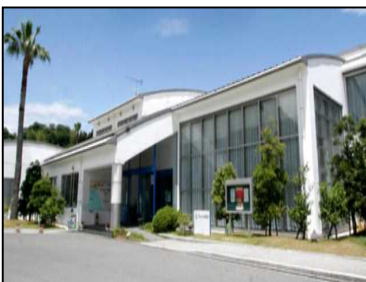
マリンパーク新居浜クラブハウス