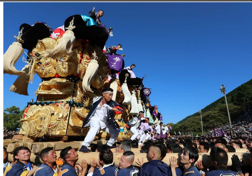
新居浜太鼓祭り の様子

★みなとオアシス マリンパーク新居浜では、新居浜太鼓祭りの開催に合わせて、パンフレット等を用いて情報発信を行います！