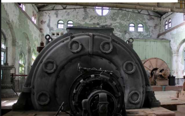
有形文化財 旧端出場水力発電所