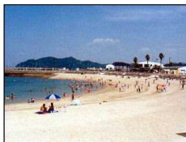
人工海浜（通称：ヤシの木ビーチ）