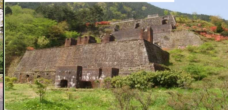
東平貯鉱庫跡・東平索道停車場跡