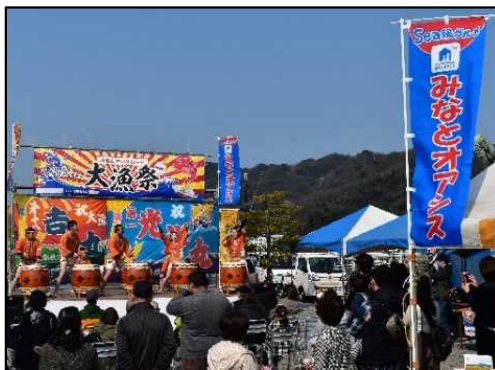
地域振興イベントの開催状況