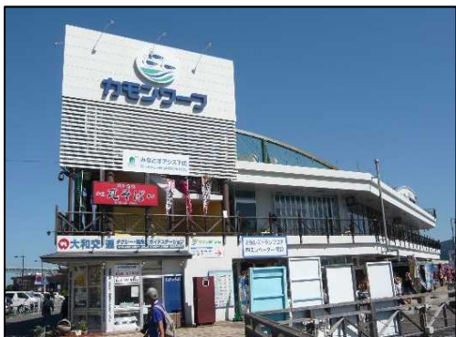
構成施設のイメージ