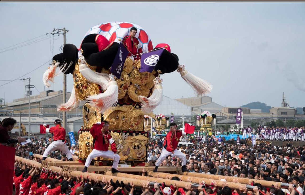
新居浜太鼓祭り さしあげ

新居浜太鼓祭りの最大の見どころは「かきくらべ」です。「かきくらべ」では、練り歩きの際に付けている車輪を外し、重さ約3トンの太鼓台を約150人のかき夫の力で担ぎ上げたり、天高く担ぎ上げる「さしあげ」や、房の割れ方、地面に降ろさずに担ぎ上げている時間などのパフォーマンスを競います。