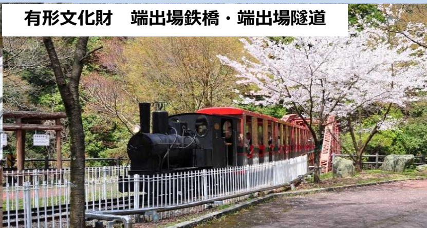
有形文化財 端出場鉄橋・端出場隧道