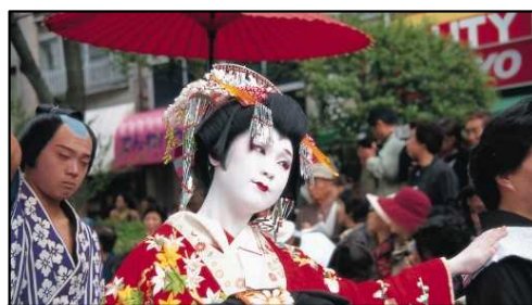
しものせき海峡まつり