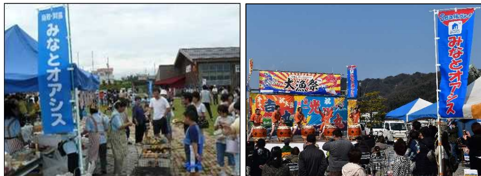
「みなとオアシス」における地域振興イベント