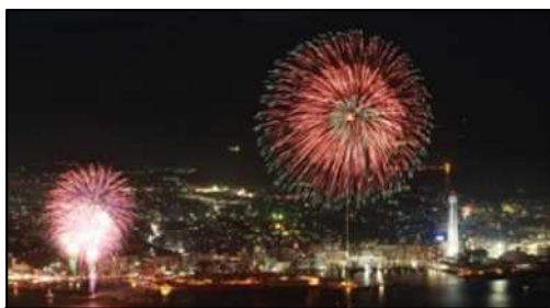
関門海峡花火大会