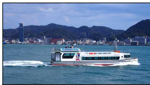
関門海峡遊覧クルージング