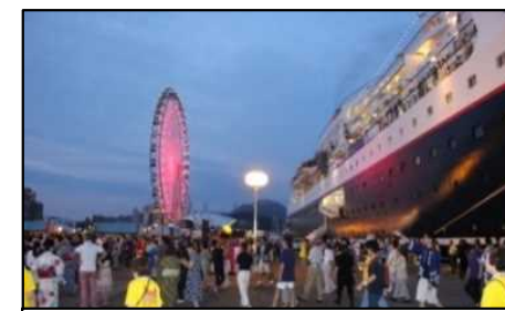
客船おもてなしイベント