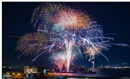
関門海峡花火大会