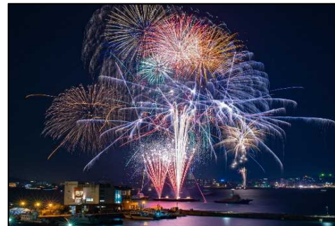
門司海峡花火大会