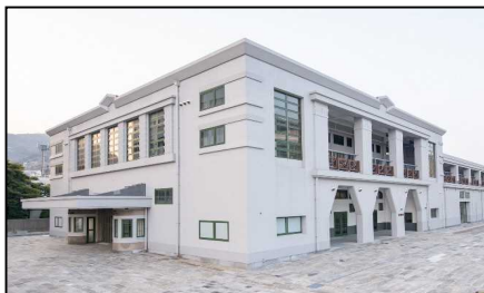
【代表施設】旧大連航路上屋