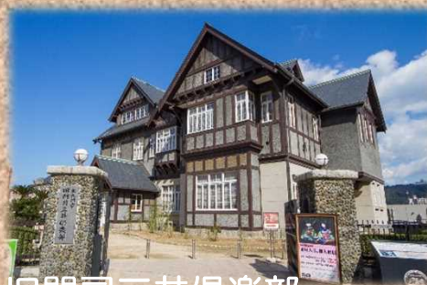
旧門司三井倶楽部

旧門司三井倶楽部は、大正10年(1921年)三井物産の社交倶楽部として建築された国指定重要文化財。アインシュタインも宿泊した格式高い社交場でした。