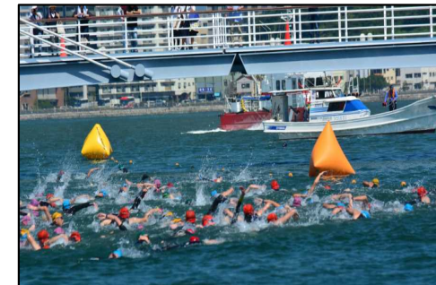
関門港ポート天国