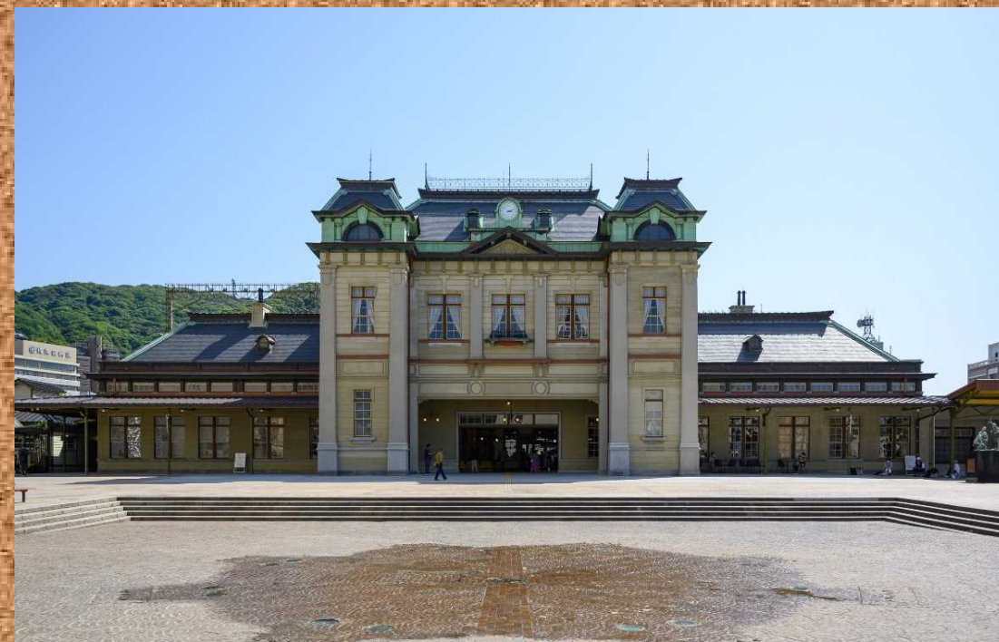
現在の門司港駅(復元)