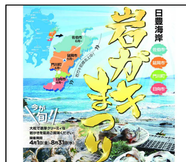
日豊海岸岩ガキまつり