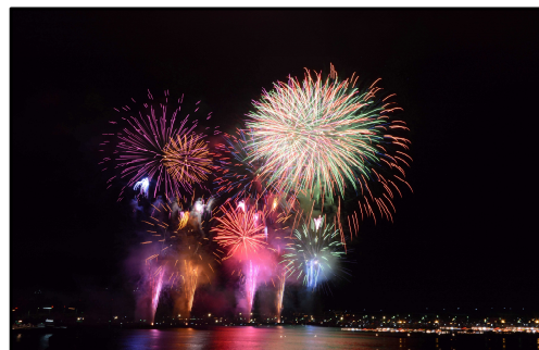
きたうら納涼花火大会