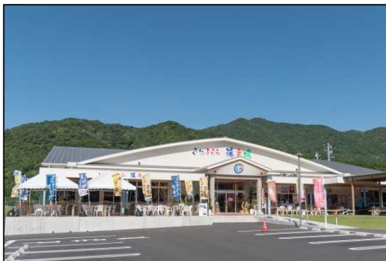
北浦臨海パーク外観（きたうら海市場）