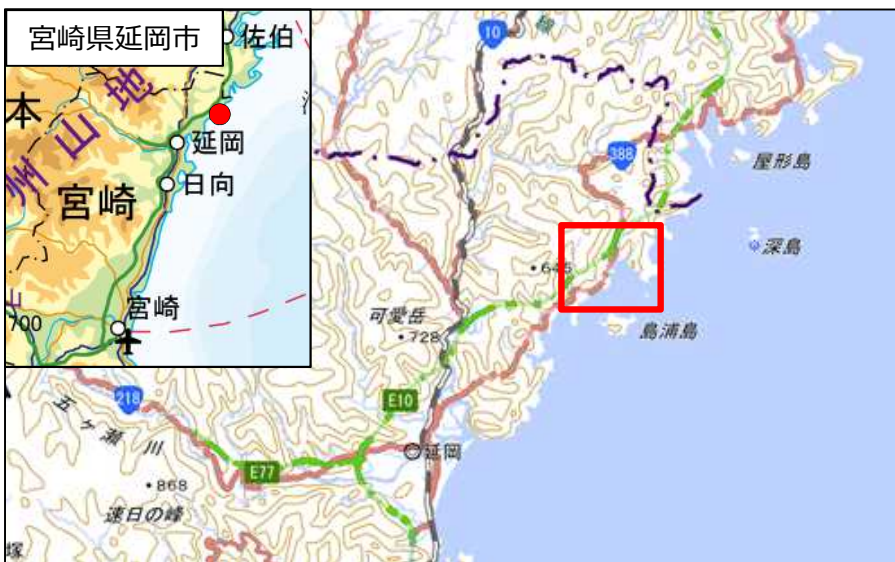
国土地理院地図（電子国土Web）( http://maps.gsi.go.jp )をもとに作成