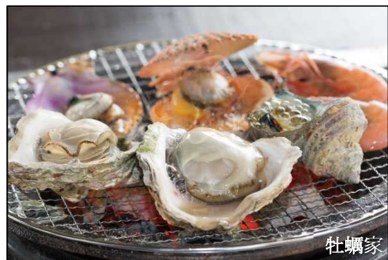
「日豊海岸岩ガキまつり」開催中！（8/31迄）

※ 「みなとオアシス」の関連情報については、下記 URL からご覧いただけます。