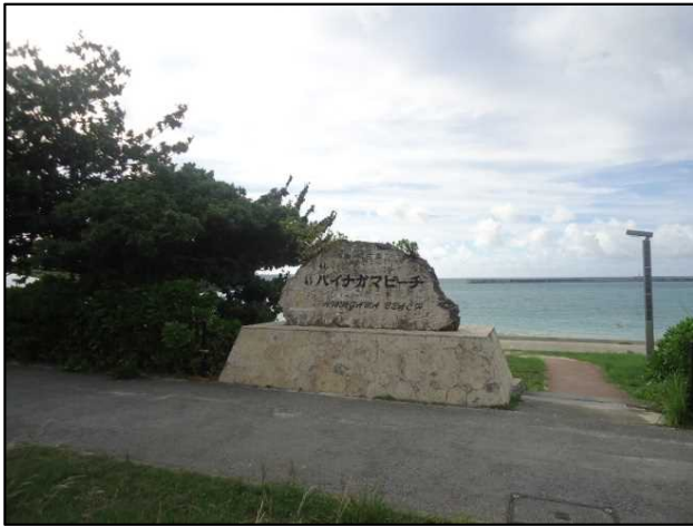
パイナガマビーチ入り口