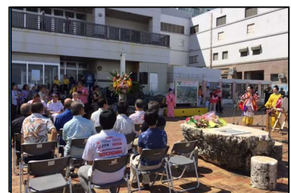
クルーズ旅客おもてなし (平良港マリントーミナルビル)