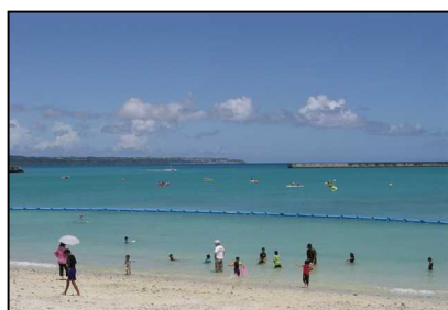
パイナガマビーチ