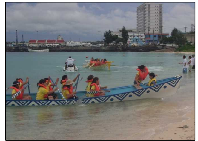
ハーリー（海神祭）の様子①