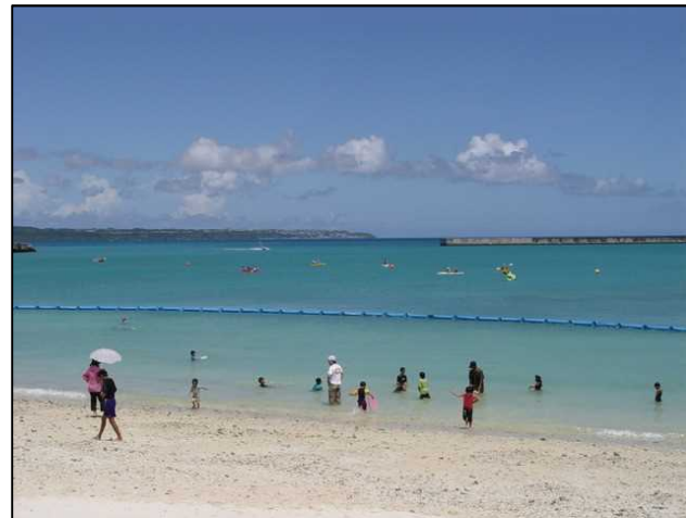
海水浴とシーカヤック（みなとフェスタ）