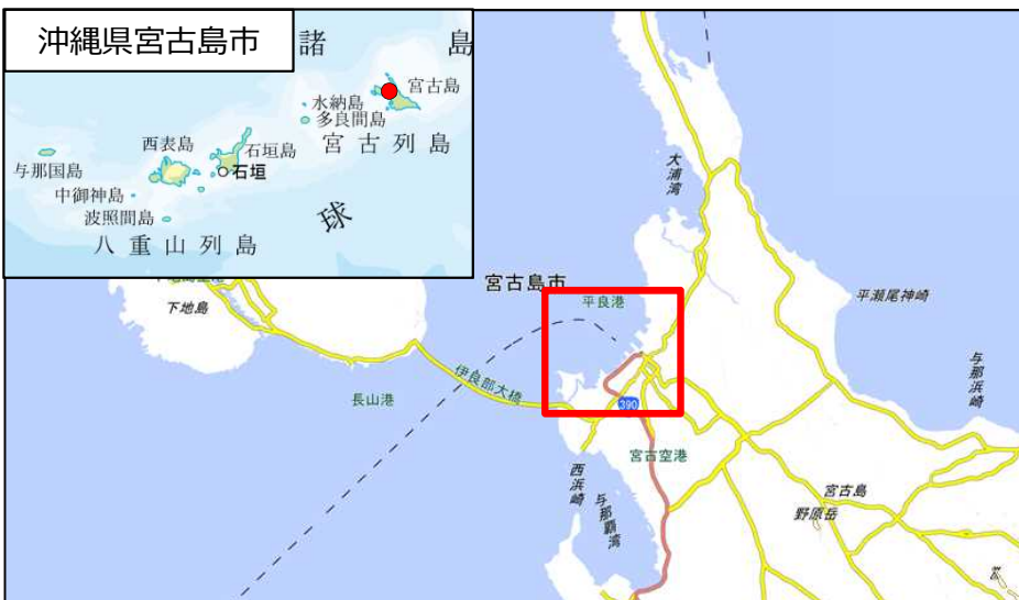
国土地理院地図（電子国土Web）( http://maps.gsi.go.jp )をもとに国土交通省作成