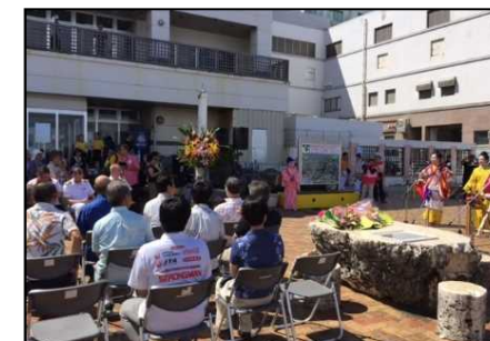
クルーズ旅客へのおもてなし