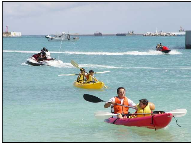
カヤックと水上バイク（みなとフェスタ）