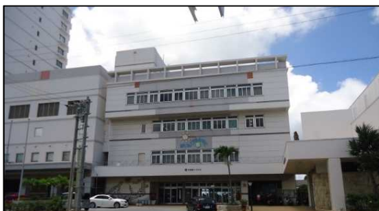
平良港マリターミナルビル