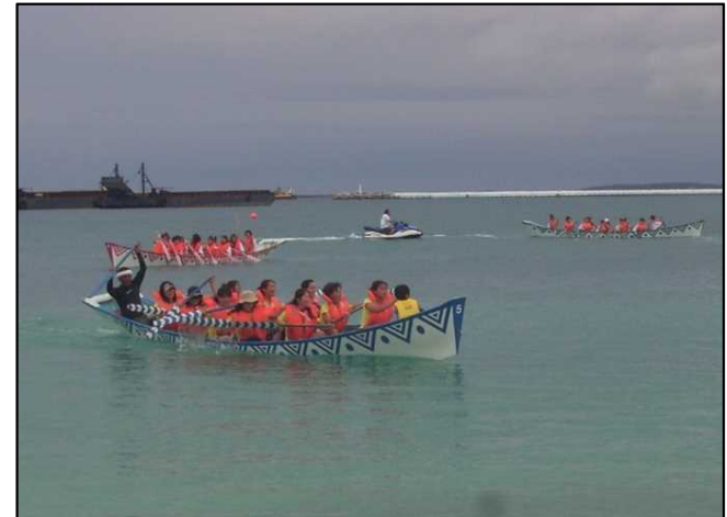
ハーリー（海神祭）の様子②