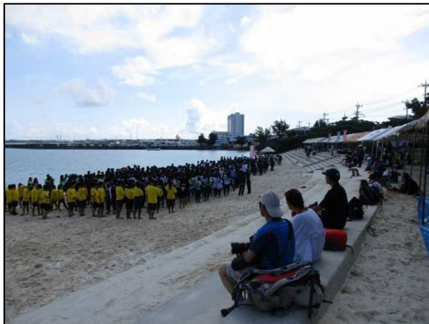
パイナガマビーチ 全景