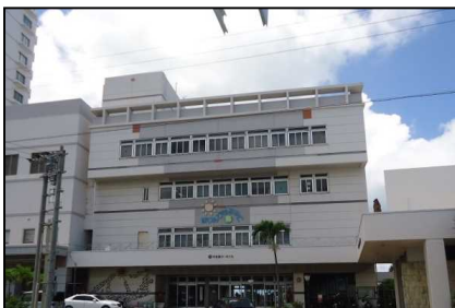
平良港マリントーミナルビル