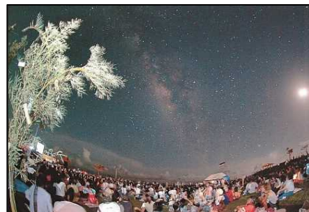
南の島の星まつり