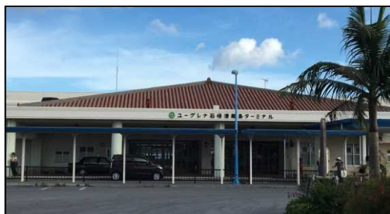
ユーグレナ石垣港離島ターミナル