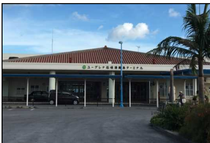
ユーグレナ石垣港離島ターミナル