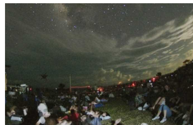
南の島の星まつり②