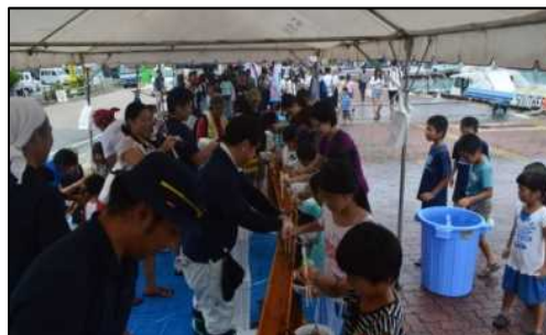
石垣港みなとまつり