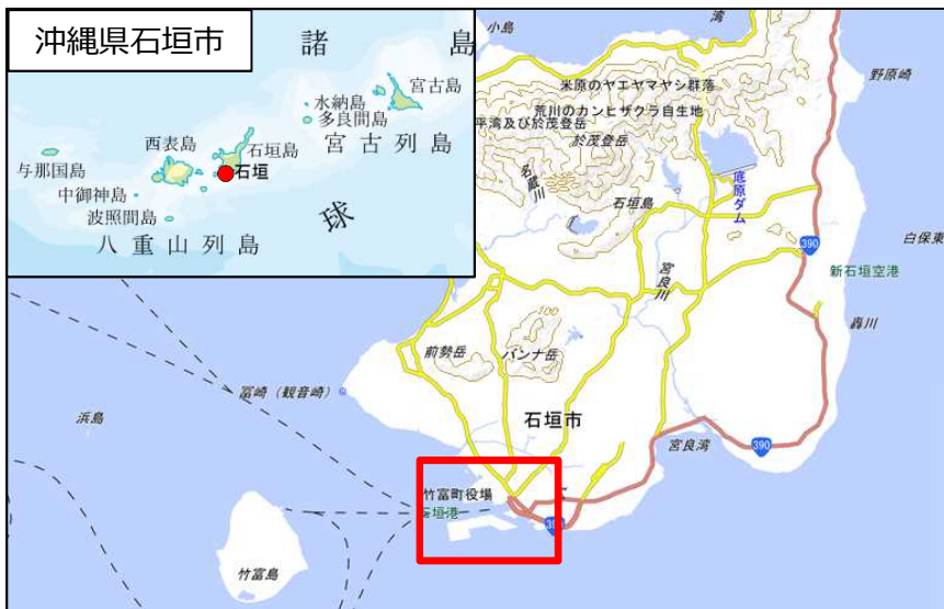
国土地理院地図（電子国土Web）( http://maps.gsi.go.jp )をもとに国土交通省作成