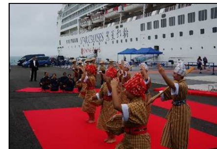
クルーズ船寄港時おもてなし