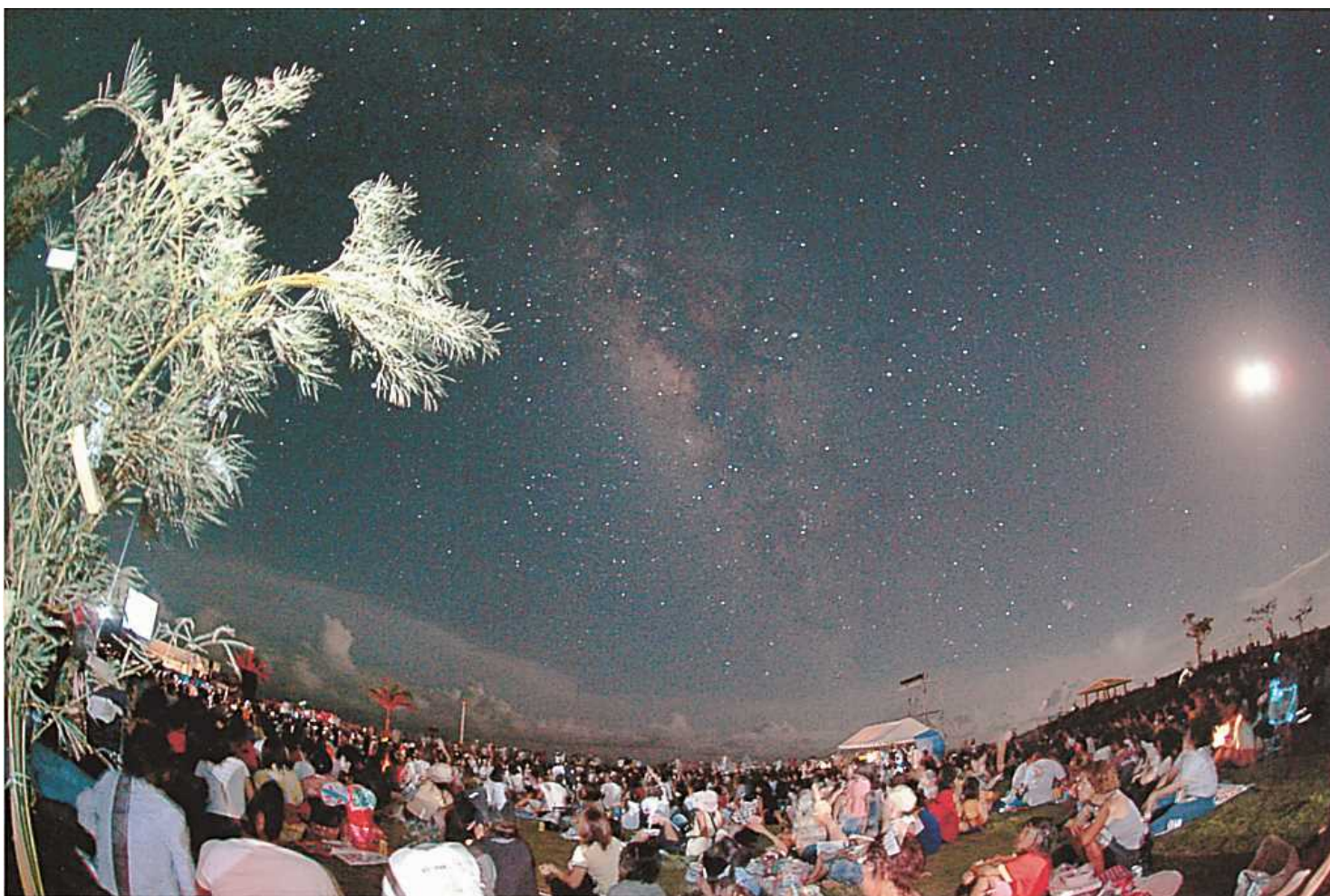
南の島の星まつり①