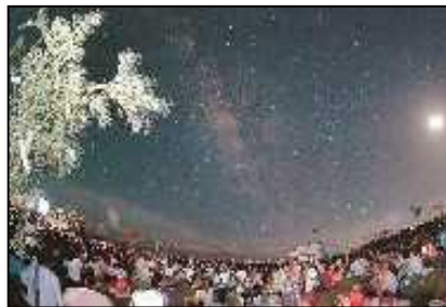
南の島の星まつり （新港地区緑地）