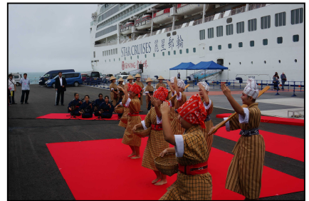
クルーズ船寄港時のおもてなし （石垣港旅客船ターミナル）

※ 「みなとオアシス」の関連情報については、下記 URL からご覧いただけます。