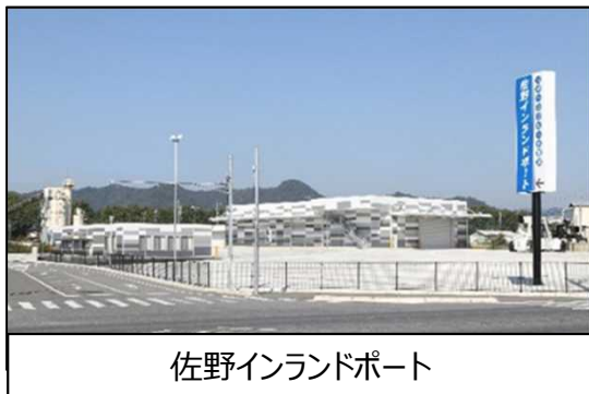
佐野インランドポート