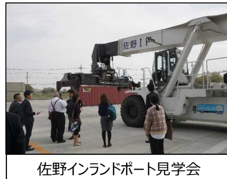
佐野インランドポート見学会