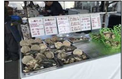
牡蠣小屋 (道の駅どまんなかたぬま)