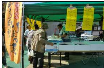
ぱるぽーとマルシェ (佐野駅前交流プラザぱるぽーと)