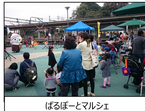
ぱるぼーとマルシェ