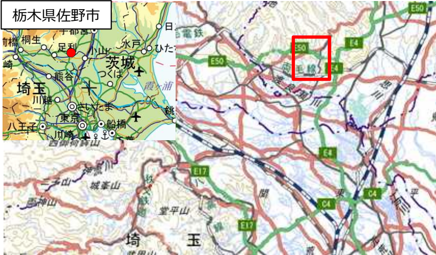
国土地理院地図（電子国土Web）( http://maps.gsi.go.jp )をもとに国土交通省作成