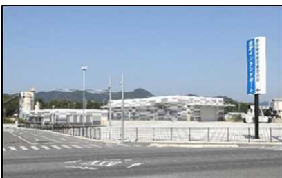
【代表施設】佐野インランドポート