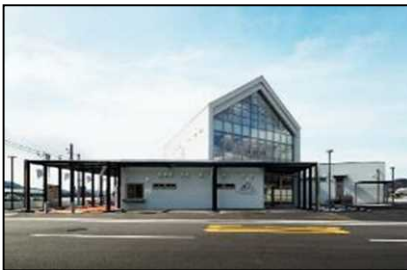
【代表施設】笠岡諸島交流センター