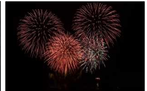
笠岡港まつり花火大会