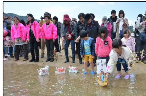
北木島流し雛フェスティバル