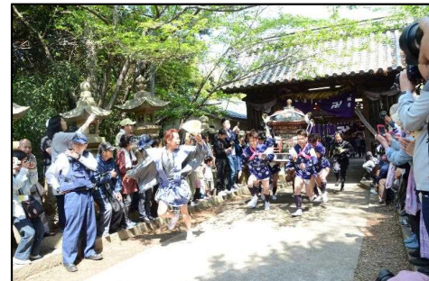
真鍋島走り神輿ツアー