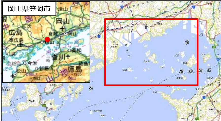
国土地理院地図（電子国土Web）( http://maps.gsi.go.jp )をもとに国土交通省作成