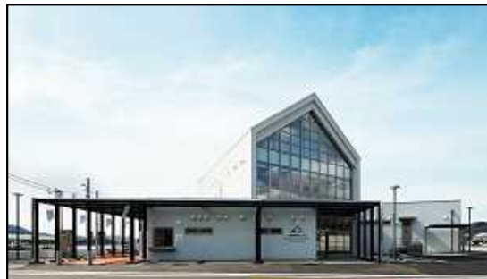
笠岡諸島交流センター