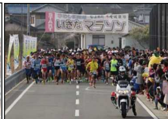
ゆめしま海道いきなマラソン大会