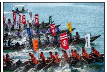
いんのしま水軍まつり