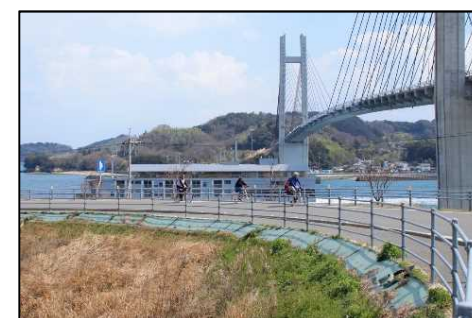
ゆめしまサイクリング