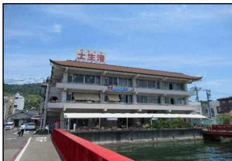
土生港旅客ターミナル