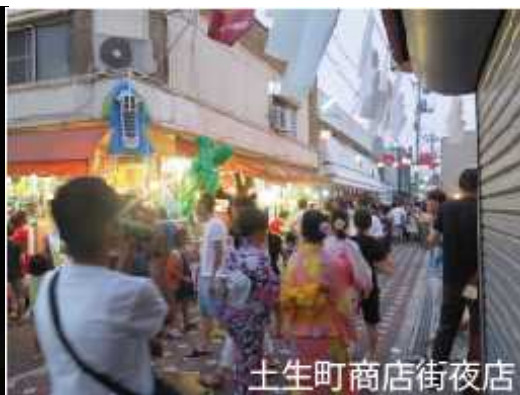
土生町商店街夜店