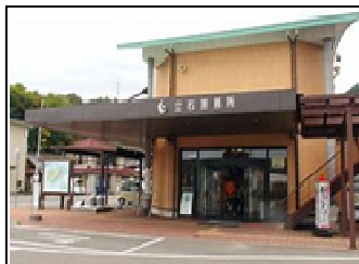
【代表施設】 立石港待合所