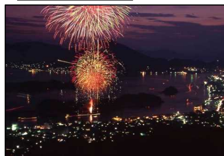
いのしま水軍花火大会