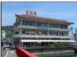
【代表施設】 土生港旅客ターミナル