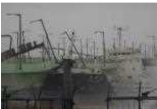
台風時の走錨により関空連絡橋に衝突したタンカー（H30）