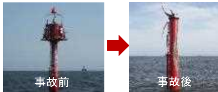
走錨船舶の接触による損傷（灯標の上部脱落） ※過去5年間における船舶接触による航路標識の被害件数 計262件