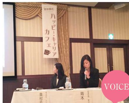
滋賀県が主催する「ハッピーキャリアカフェ」でパネリストを務める当社女性社員（右）。「仕事で得られる達成感や家庭にいる中では味わえませんが、子供がいて様々な制約があるからこそ、落ち込んだときにも頑張れるように思います」