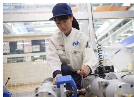
2011年にグッドデザイン賞を受賞した製品組立工場内作業ルームで、快適な作業環境のもと女性社員が小型ポンプの組み立て作業に従事しています。