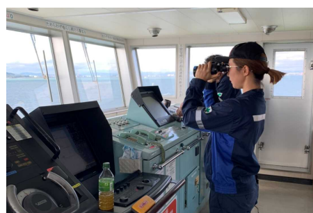
タンカー船のブリッジにて：航海当直中の見張り風景。三等航海士としての経験はまだ浅いものの、持ち前のやる気と行動力で貴重な戦力となっており、船長はじめクルーからの信頼は厚い。

今後も更なる環境改善に努め雇用の維持を図り、女性にとって海事業界が特別な職場でないことを根付かせていきたいと思えます。