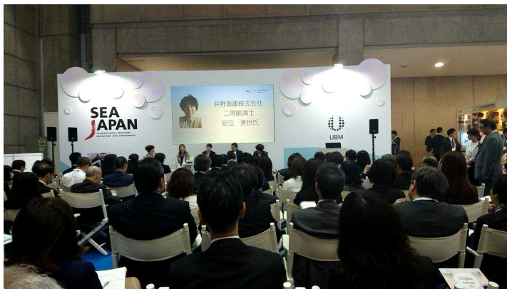
東京ビッグサイトにて開催された SEA JAPAN 2018。そのイベントとして企画された SEA JAPAN WOMAN in Maritime に弊社の二等航海士（現船長）が海事産業で活躍する女性として選出され、パネルディスカッションに参加。