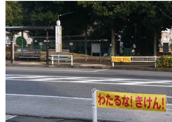
バス停周辺での事故防止啓蒙