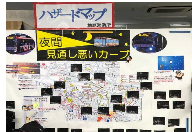
ハザードマップによる危険箇所の洗い出し、共有