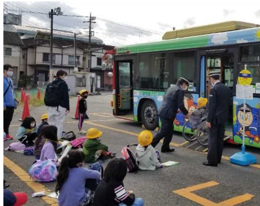
小学生を対象としたバス乗り方教室