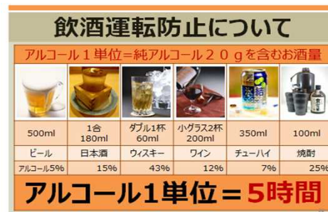
飲酒運転防止啓蒙資料