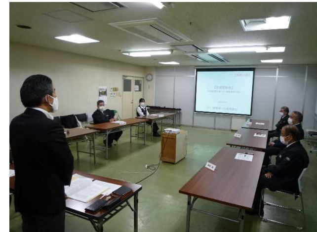
社長懇談会開催の様子