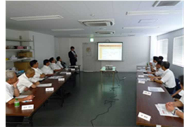
定期研修座学（接遇・事故防止講習）