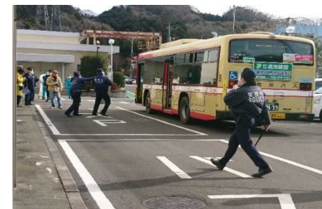
バス車内緊急事態対処訓練の様子