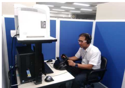
ナスバネットによる適性診断（3年毎）