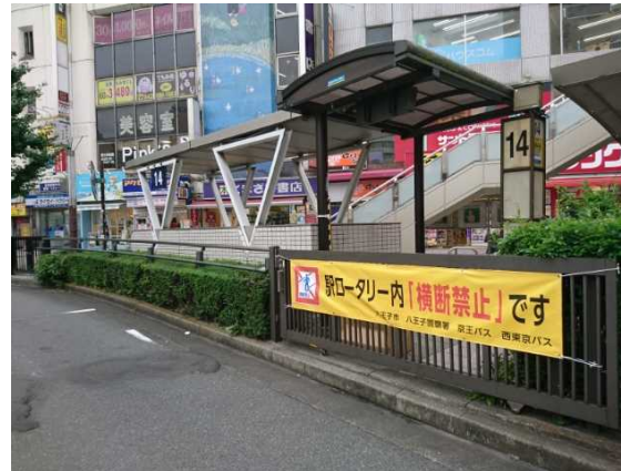
駅ロータリー内「横断幕」更新