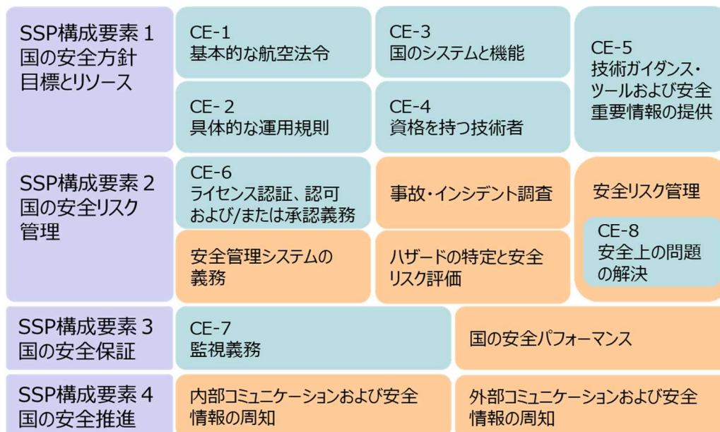
図 1 4 つの構成要素及び 8 つの重要要素構成図

ICAO が提示している 4 つの構成要素及び 8 つの重要要素を中心とした安全計画・管理のフレームワークは、図 1 のとおりである。