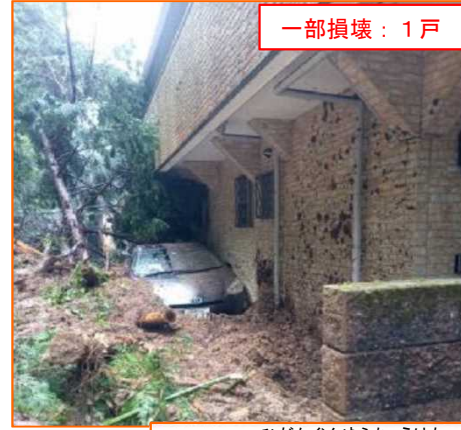
6/2 がけ崩れ いずみし はるきがわちよう 大阪府和泉市春木川町