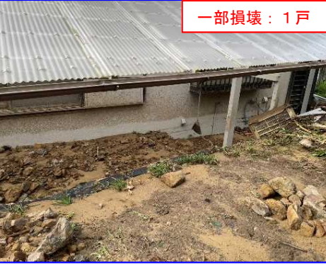
土石流 ひだかぐんゆらちようはた 和歌山県日高郡由良町畑