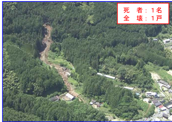
6/2 土石流 はままつし きたく いなさちようしぶかわ 静岡県浜松市北区引佐町渋川