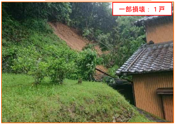
6/2 がけ崩れ きたしたらぐんしたらちようきよさき 愛知県北設楽郡設楽町清崎