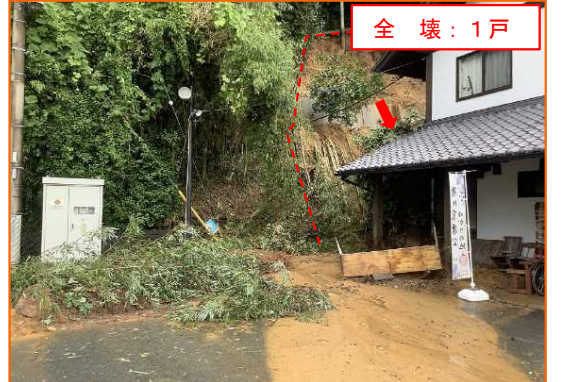
6/2 がけ崩れ はままつし にしく かんざんじちよう 静岡県浜松市西区館山寺町