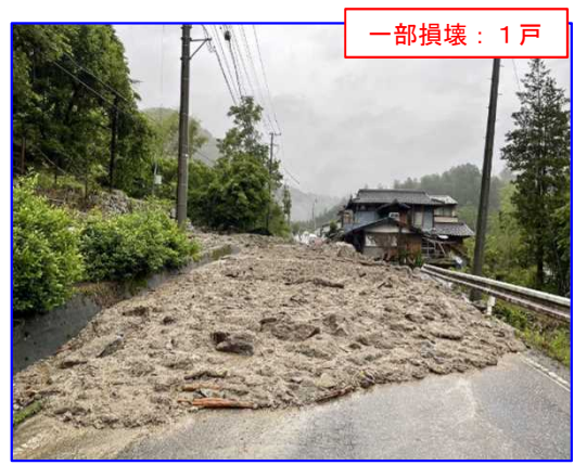
6/2 土石流 いいだし みなみしなの みなみわだ 長野県飯田市南信濃南和田

【被害状況】 人的被害：死者 1名 負傷者 1名 家屋被害：全壊 3戸 一部損壊 17戸