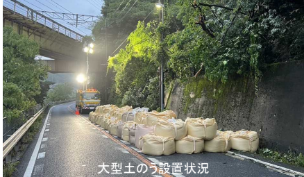
大型土のう設置状況

国道25号〔通行止め解除〕 かしはらしこくふひがしよちよう 柏原市国分東条町～北葛城郡王寺町藤 (2.5km) ・倒木・法面崩落