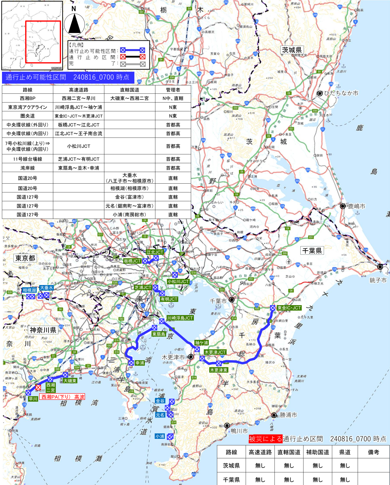
通行止め可能性区間 240816_0700 時点