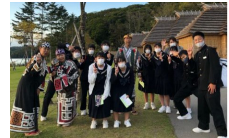
来場者とのふれあい