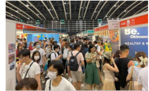
香港ブックフェア