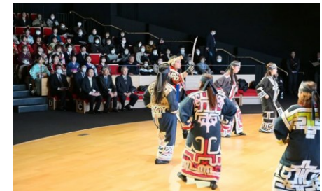
令和6年白老町二十歳を祝う会（R6.1）