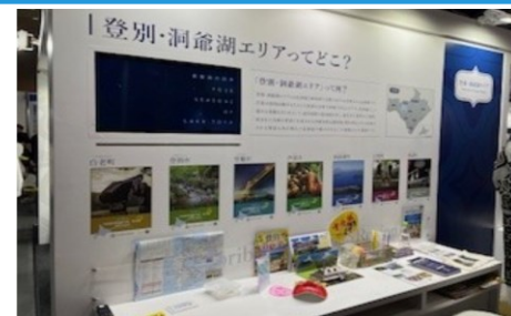
「西いぶり」地域で連携した情報発信（ツーリズムEXPOジャパン（R5.10大阪））