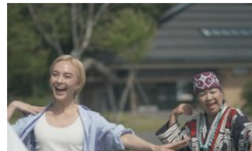
外国語案内を含む外国人来場者対応