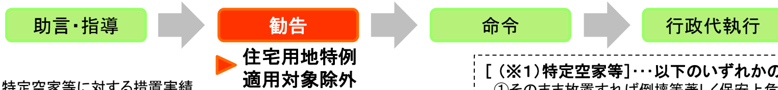
特定空家等に対する措置実績

市区町村長から 勧告 を受けた 特定空家 の敷地について、 住宅用地特例の適用対象から除外