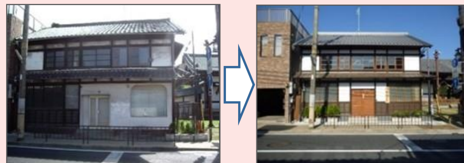
地域活性化のため、空き家を活用し観光交流施設を整備