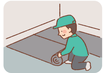
床に防音下地材を設置