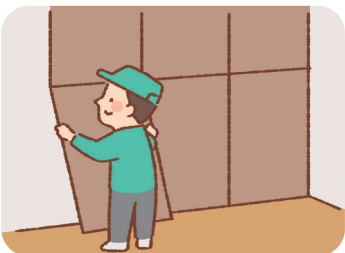
壁などに遮音材の取り入れ

遮音改修は、床、壁、天井に、遮音材、吸音材、防振材などを入れ、 防音性を高める ことが基本です。二重窓の設置や外壁に断熱材を取り入れるなどの 断熱改修 も同時に行えば、冷暖房効率が高まり 省エネ に繋がるため、一石二鳥です。