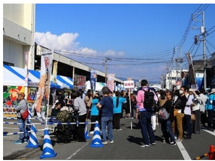
地域振興イベントの開催状況 (Sea級グルメ全国大会in津津)