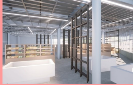
ポートマルシェotaru(オタルエ)(物販)