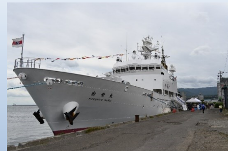
水産庁 北海道漁業調整事務所 漁業取締船 白竜丸