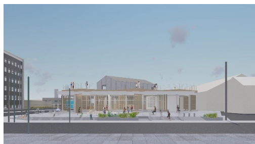
小樽国際インフォメーションセンター