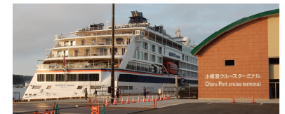
小樽港クルーズターミナル

北海道開発局記者発表 http://www.hkd.mlit.go.jp/ot/release/juthpp0000007420.html