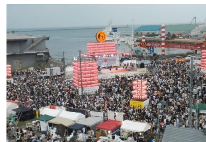
おたる潮まつり(7月)