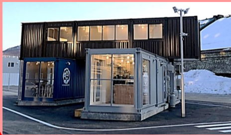
コンテナ店舗(飲食)

小樽地域の情報発信や物販等のサービス提供を行い、賑わい空間を創出する観光拠点であり、交流機能、休憩機能、情報提供機能、商業機能が複合的に備わる施設である。