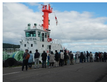
官公庁船一般公開