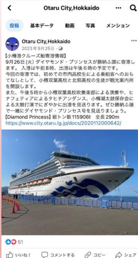
Facebookによる 情報発信イメージ