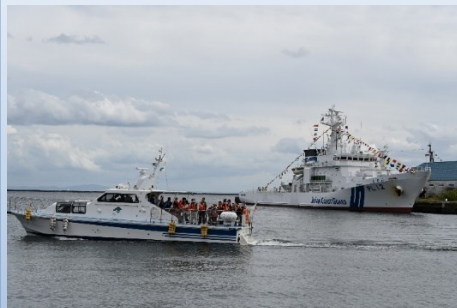
北海道開発局 小樽開発建設部 港湾業務艇 みずなび

小樽港や港湾関係機関の役割等を市民等に紹介し、理解を深めることを目的に、港湾関係機関船舶等の一般公開や体験乗船会を開催。