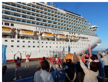
クルーズ船歓迎イベント