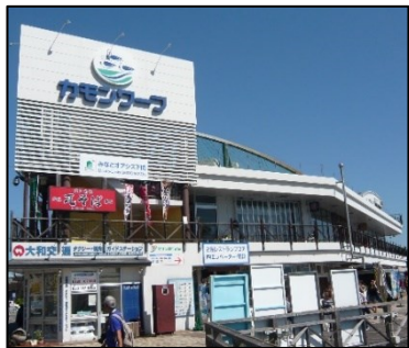
構成施設のイメージ (下関港、カモンワープ)