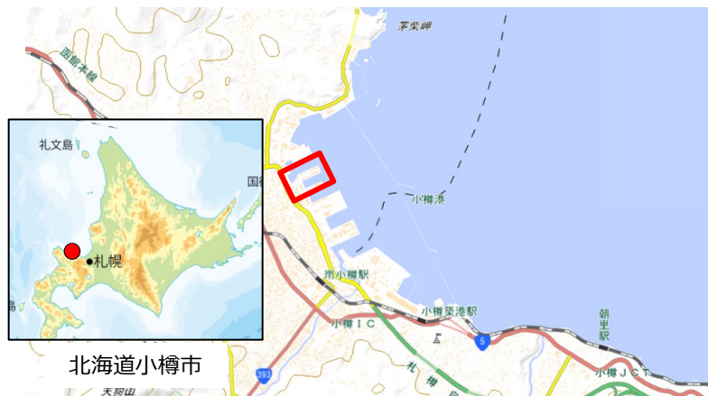
北海道小樽市 国土地理院地図（電子国土Web）( http://maps.gsi.go.jp )をもとに小樽市作成