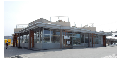
小樽国際インフォメーションセンター

○登録にあたり下記のとおり、構成施設「小樽クルーズターミナル」にて登録証交付式を行います。なお、同日、構成施設の一つである「小樽港第3号ふ頭クルーズ船岸壁(本年3月完成)」において、ダイヤモンド・プリンスの入港に合わせ、小樽市と北海道開発局小樽開発建設部が主催して、同岸壁の供用開始式典を開催します。