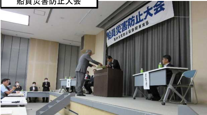
船員災害防止大会