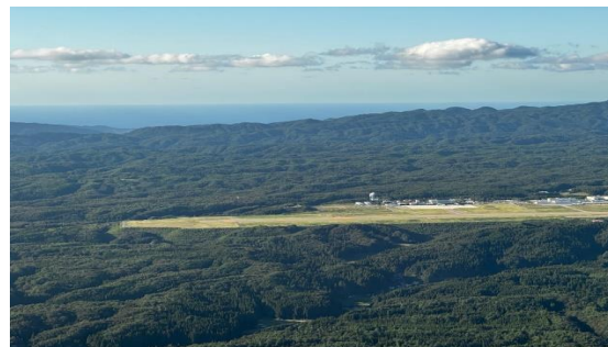
(空港上空からの眺望)