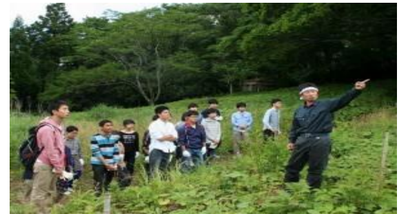
金沢大学能登里山里海SDGsマイスタープログラム