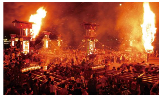
(あばれ祭り (能登町))