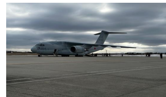
(着陸した自衛隊機)