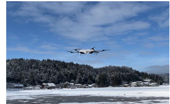
(ドローンによる支援物資輸送)