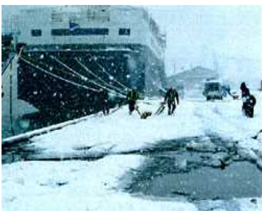
写真5：吹雪の中での繫船作業（伏木富山港）