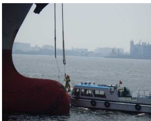
写真1：本船よりロープを受け取る繫船ポート（東京港）

一方、何らかの要因により繫留ロープが切断し、作業員に接触すると人命にも関わる可能性があります。