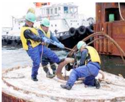
写真4：不安定な足場での繫船作業（函館港）