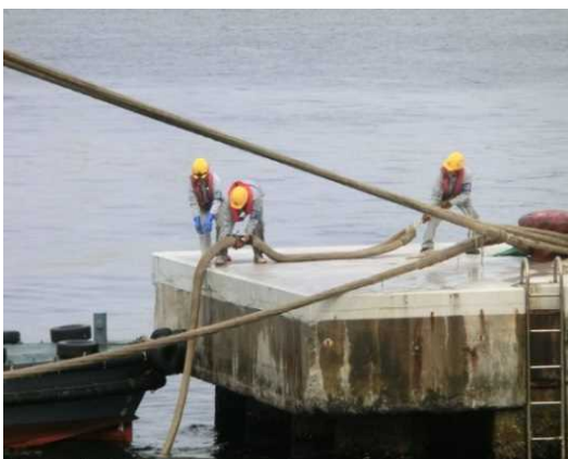
写真3：係船柱にロープをかける作業（神戸港）