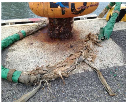
写真6：劣悪な係留ロープ