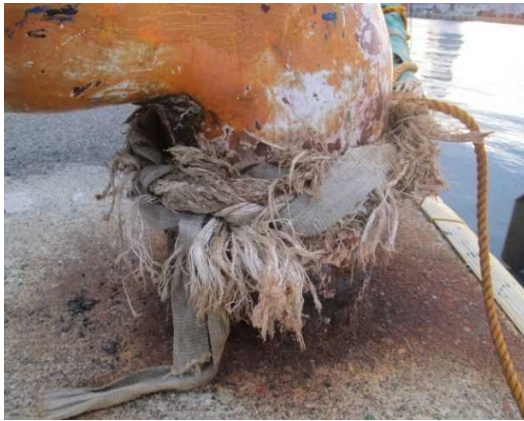
写真7：劣悪な係留ロープ