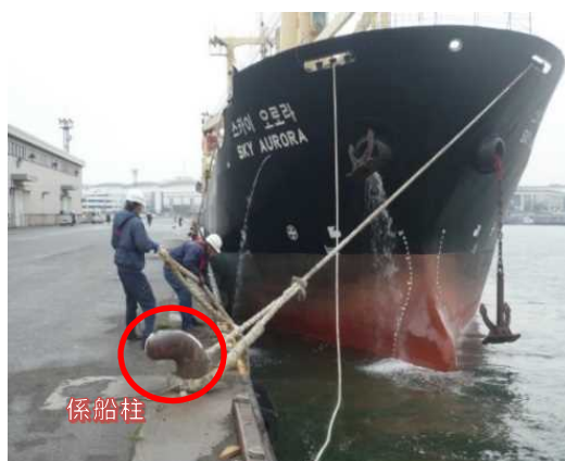
写真2：係船柱にロープをかける作業（名古屋港）