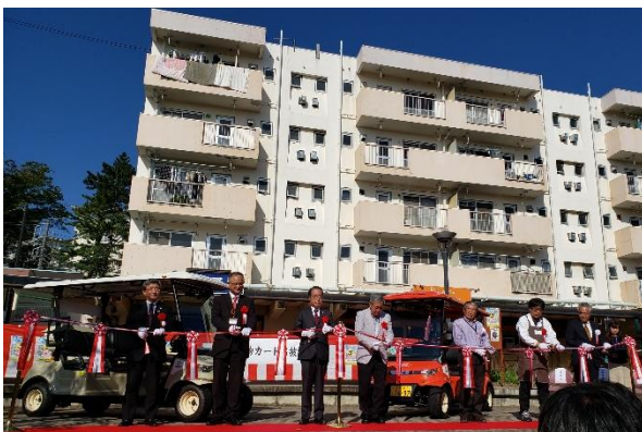
10月28日に行われたオープニングセレモニーの様子