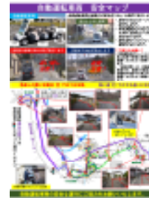
周知チラシ(安全マップ)