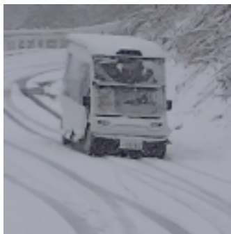
積雪状態での走行検証