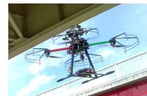
ドローン(点検技術)