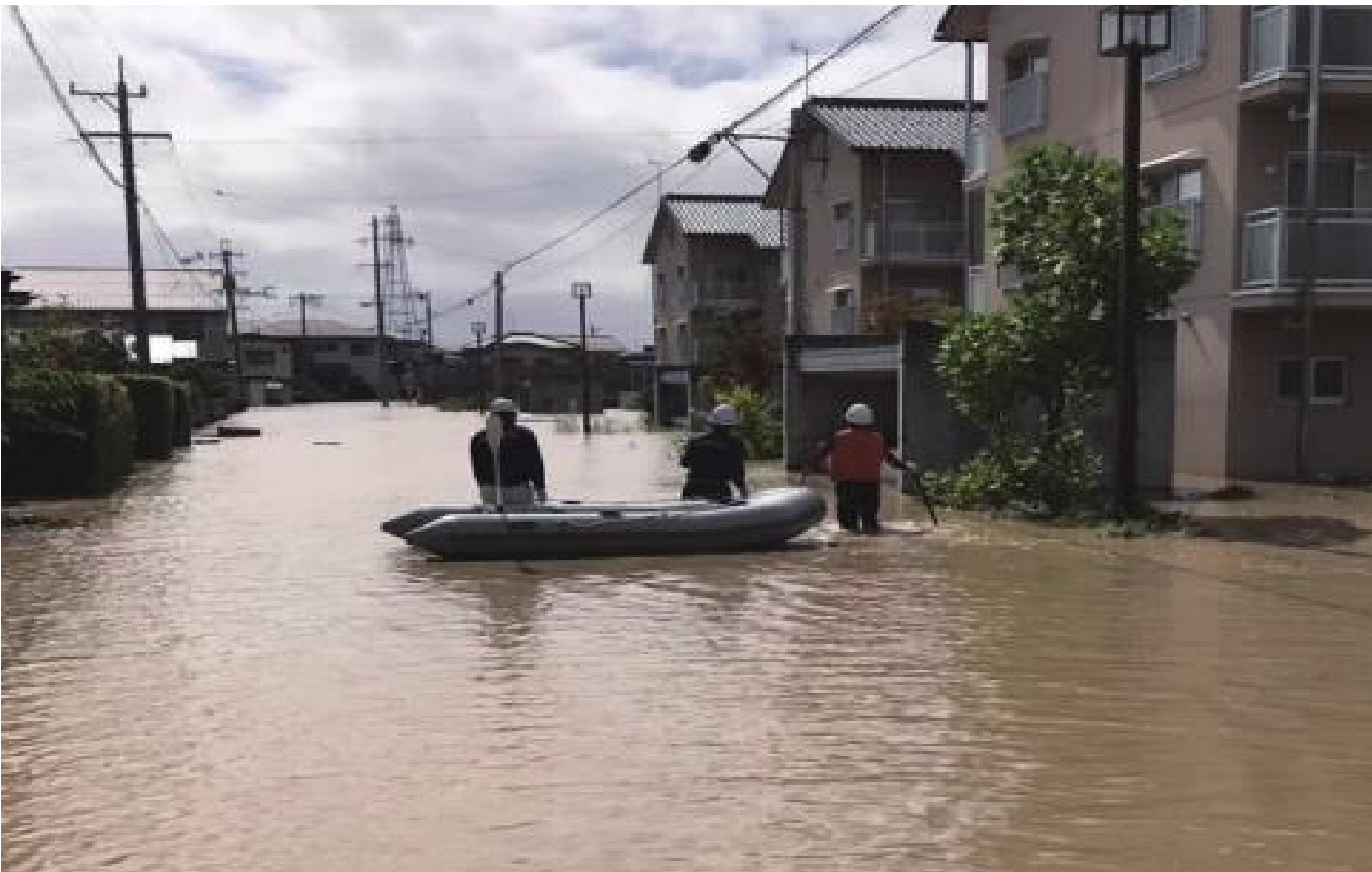
長野県長野市消防団 ゴムボートによる救出活動を実施(令和元年10月12日~15日:長野市内)