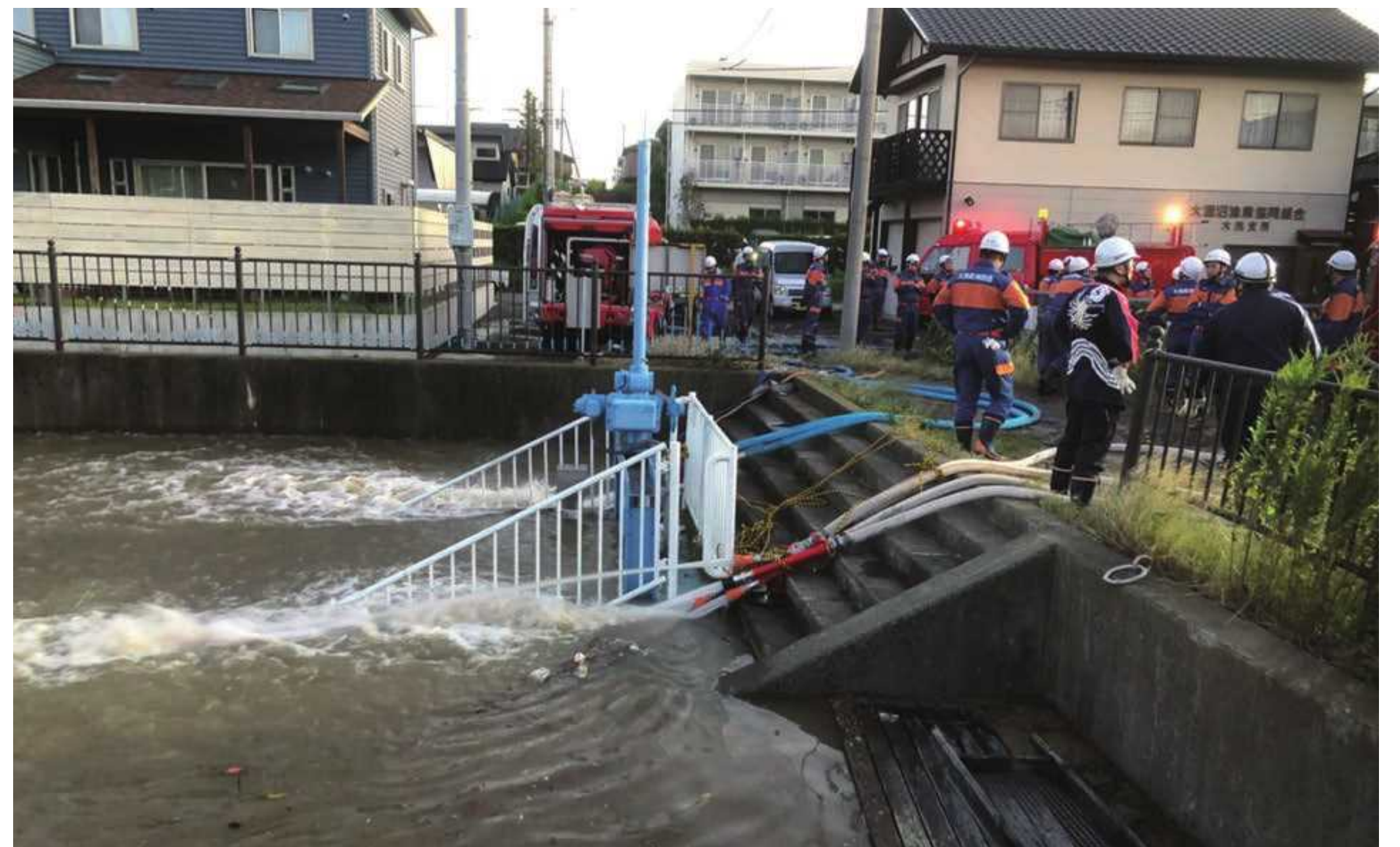
茨城県大洗町消防団 排水活動を実施(令和元年10月12日~13日:大洗町内)