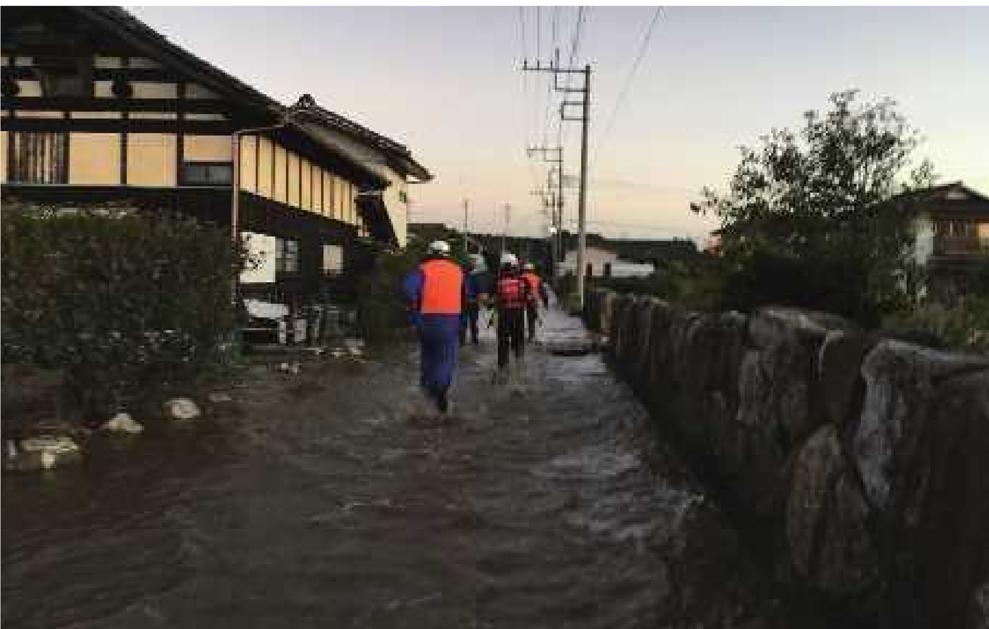
茨城県常陸太田市消防団 住民の安否確認・人命救助を実施(令和元年10月12日~14日:常陸太田市内)