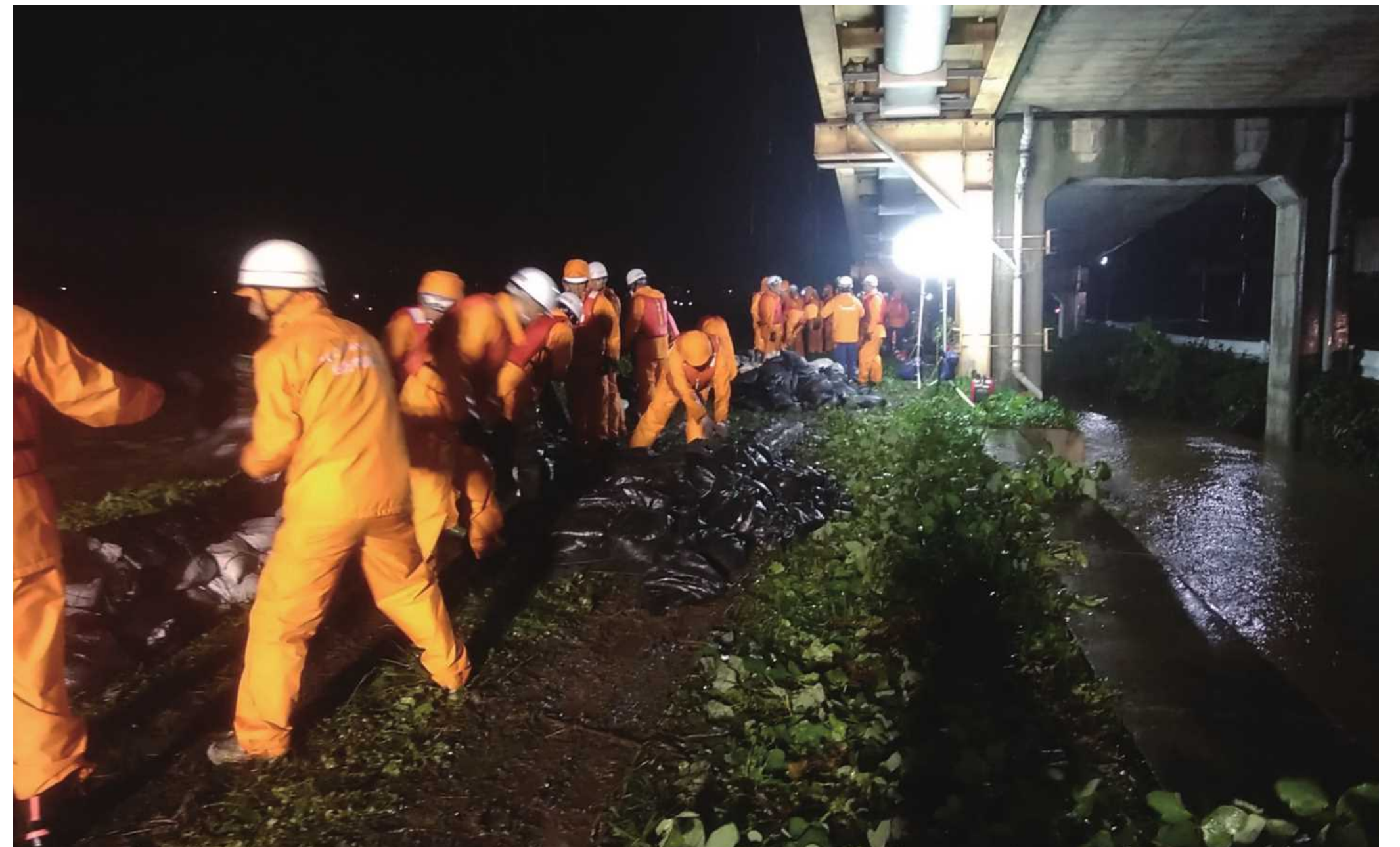
東京都日野市消防団 土のう積み工を実施(令和元年10月12日~13日:浅川右岸)