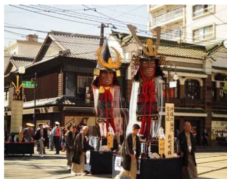
【藤崎八幡宮例大祭の神幸行列】

国指定の重要文化財「熊本城」を核として、周辺に広がる城下町一帯を行列が練り歩く藤崎八幡宮例大祭、また、史跡「熊本藩川尻米蔵跡」を有し、かつて港町として栄えた町並みを背景に行われる河尻神宮秋季大祭などにより形成される、歴史的な風情を有する良好な市街地の環境の維持向上を図るため、熊本地震により被災した「熊本城」をはじめとする歴史的建造物の保存修理・修景や、市内の歴史的建造物を回遊するための道路の美装化、歴史・文化を活かした観光体験事業等を位置づけています。