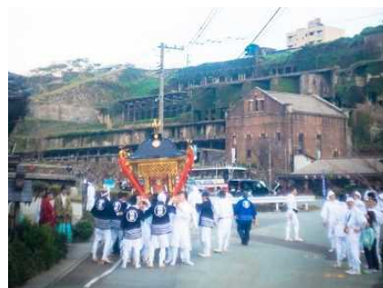
【佐渡市】善知鳥神社祭礼

国指定の重要文化財「旧佐渡鉱山採鉱施設」、国指定の史跡「佐渡金銀山遺跡」及びその周辺の鉱山町一帯と、善知鳥神社祭礼や鉱山祭とそこで披露される郷土芸能、無名異焼の製造・販売等が一体となった、歴史的な風情を有する良好な市街地の環境の維持向上を図るため、歴史的建造物の保存修理、公有化した旧深見家住宅等の歴史的建造物を活用した拠点施設整備、それら歴史的建造物を回遊するための道路の美装化等の事業や、相川音頭を踊るイベントの宵乃舞など、地域行事の運営に対する支援を位置づけています。