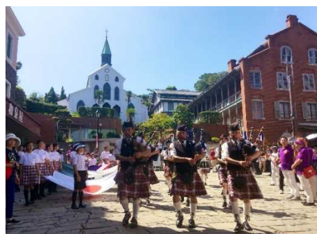
【長崎居留地まつり】

国宝「大浦天主堂」や国指定の重要文化財「旧グラバー住宅」、及びその周辺地域と、歴史的建造物等の保存活動の一環として始まった長崎居留地まつりや大浦諏訪神社の大浦くんち等の伝統的な活動が一体となった、歴史的な風情を有する良好な市街地の環境の維持及び向上を図るため、旧グラバー住宅をはじめとする歴史的建造物の保存修理や、夜間景観の整備、景観を損なう空き家の除却等の事業を位置づけています。