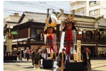
【熊本市】藤崎八幡宮例大祭の神幸行列