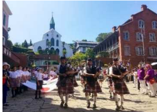
【長崎市】長崎居留地まつり