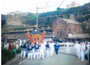
【佐渡市】善知鳥神社祭礼