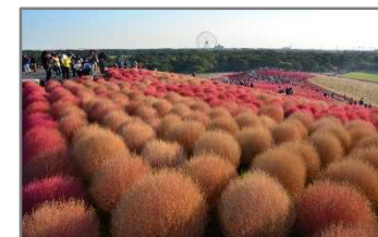
【国営ひたち海浜公園】