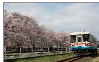
【ひたちなか海浜鉄道】