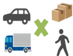
<モノとヒトの輸送>