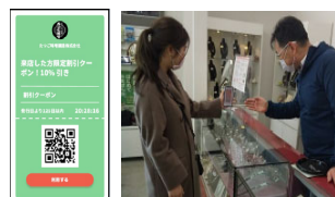
<商品サービス提供の様子>