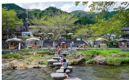
長門湯本地区（長門市）

本冊子は「官民連携まちづくりポータルサイト」の手引き・通知・パンフレットに掲載しています。