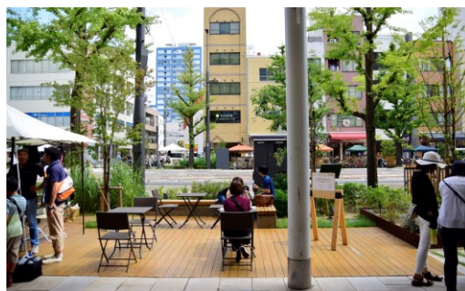
花園町通り地区（松山市）