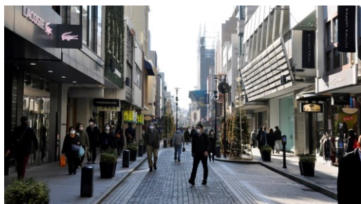
横浜元町地区（横浜市）

○ 先進的取り組みを実施している以下の6事例を中心に、全国の都市の参考となる全98事例を紹介しています。