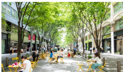
大丸有地区（千代田区）