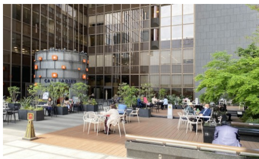
天神明治通り地区（福岡市）