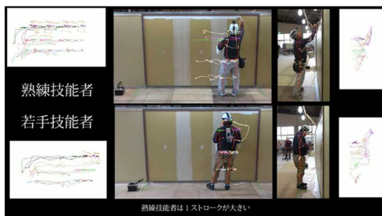
塗装工の熟練技能者と若手技能者の比較

各職種の熟練技能者がどのように作業をしているかについて、電子ブックや動画などによって無料で学ぶことが出来ます。ぜひご利用ください！