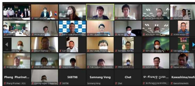
ミーティングの様子

来年3月までの期間で、別途 JICA 調査により策定中のシェムリアップのスマートシティに向けたロードマップにおける重点プロジェクト(道路監視 CCTV システム導入等)について、現状把握・情報収集や実現に向けた計画検討を行う。