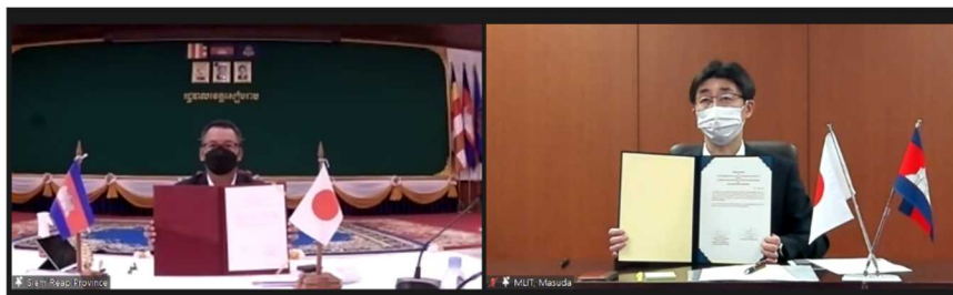
ティア・セイハ州知事(左)と増田参事官(右)による署名式の様子