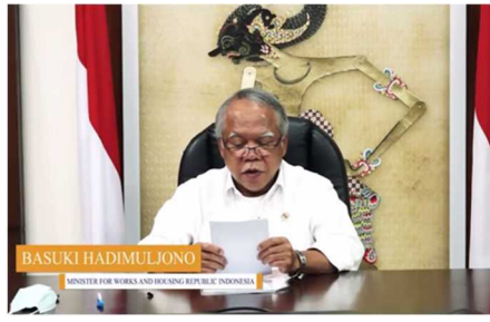
バスキ インドネシア公共事業・国民住宅大臣