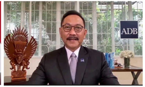
スサントノ アジア開発銀行副総裁