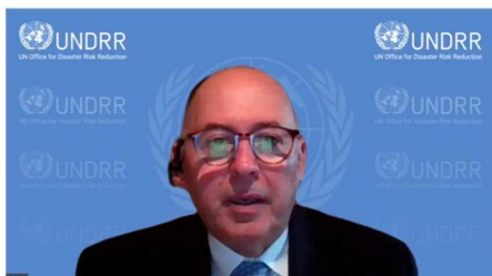
メナ 国連防災機関事務局長