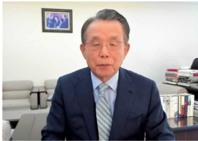
ハン・スンス 韓国元首相/HELP 議長

ハン・スンス韓国元首相・HELP 議長をはじめ、HELP メンバー/アドバイザーによるキーノートスピーチ/ビデオメッセージが行われました。