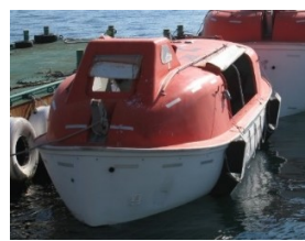
部分閉囲型救命艇