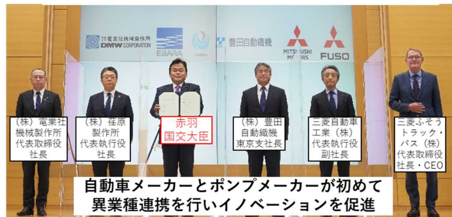
マスプロダクツ型排水ポンプ実証試験の共同実施に関する基本協定

実証試験 R3. 12. 16～R4. 1. 21 ●現場実証の公募 R4. 1. 31～R4. 2. 18 ●土木研究所での実証試験の実施 R4. 3. 16 ●現場実証市区町村の決定