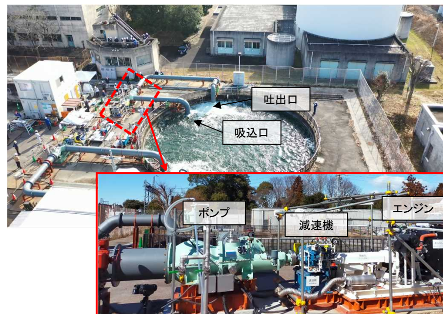
土木研究所での実証試験