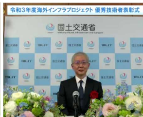
小澤委員長による祝辞