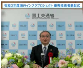
吉岡技監による祝辞