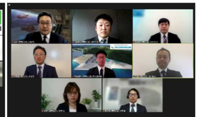
国土交通大臣奨励賞 受賞者