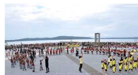
オープンエアを活用した交流拠点の形成・イベント開催