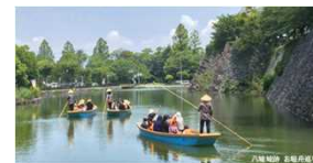
プライベート感を重視したツアーの形成