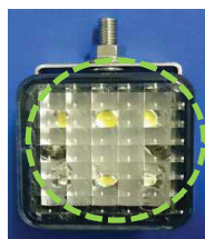
LEDバックランプ本体