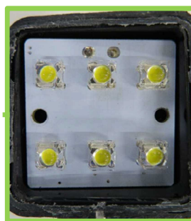
LEDバックランプ レンズカバー除去後(LED素子 計6点)