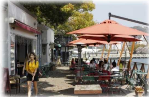
河岸緑地へのオープンカフェの設置 (京橋川/広島市)