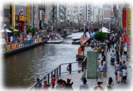
水面上遊歩道のイベントや舟運等での活用 (道頓堀川/大阪市)