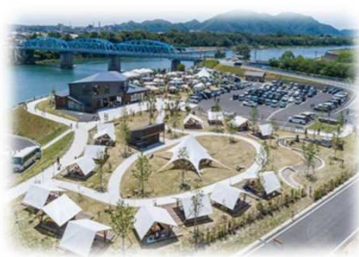
河川敷広場への新たな賑わい拠点の整備 (木曾川/美濃加茂市)