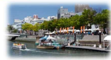
親水護岸の利用 (新町川/徳島市)