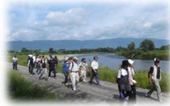
河川管理用通路の利用 (最上川/長井市)