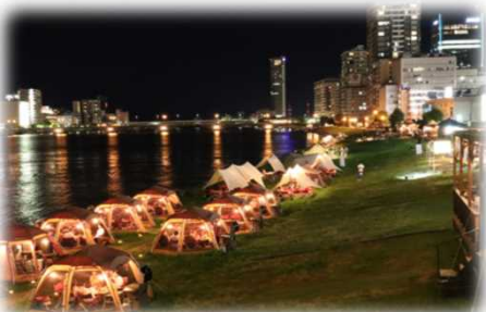
民間事業者のエリアマネジメントによる 管理・運営(信濃川/新潟市)