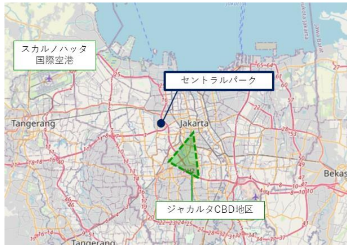
※© OpenStreetMap contributors (opendatacommons.org) (一部加工)