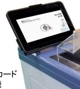
非接触型クレジットカード 決済読み取り機