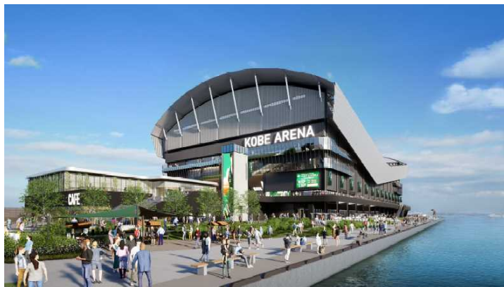
新港突堤西地区（第2突堤）完成イメージ