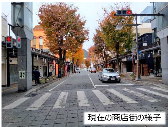
現在の商店街の様子