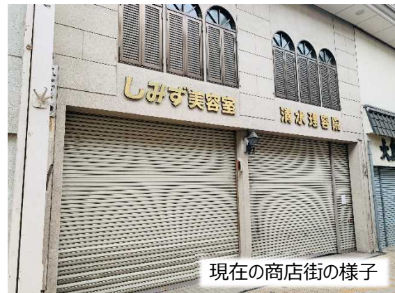
現在の商店街の様子

今後のまちづくりについてお悩みの場合には、お気軽に以下のお問い合わせ先までご相談ください。